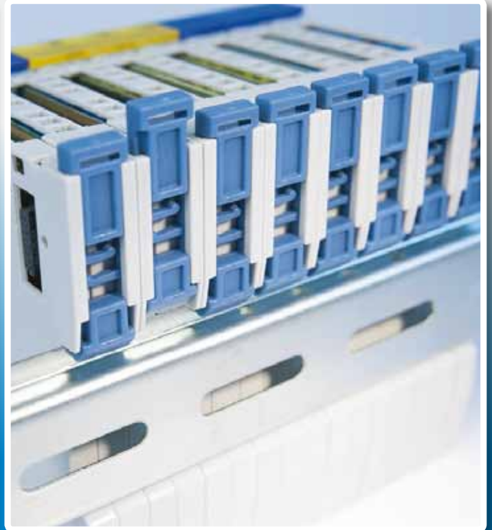
Die clevere mechanische Querverriegelung sorgt für die formschlüssige und vibrationsfeste Verbindung der Module.