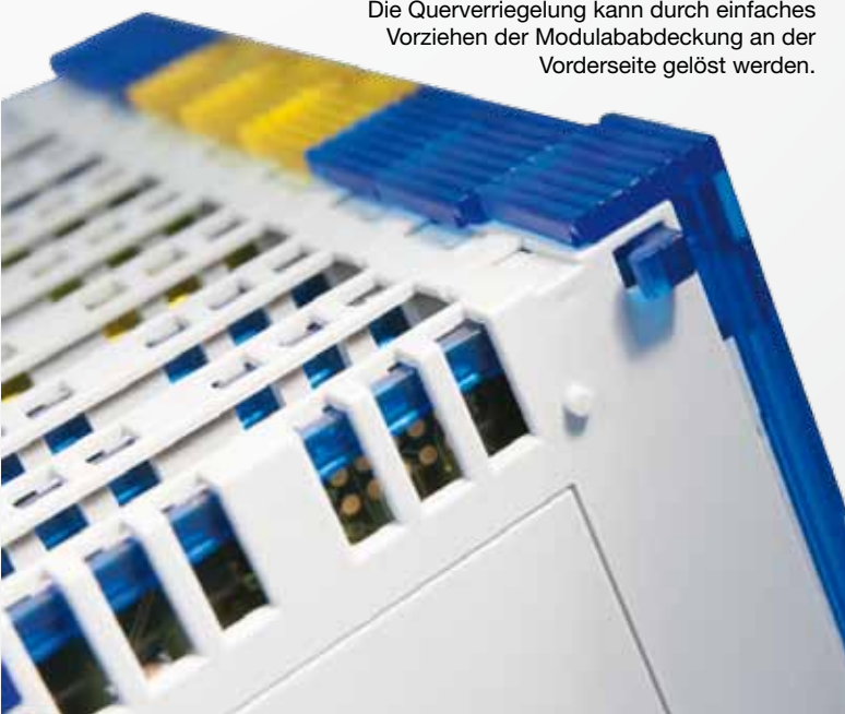
Die Querverriegelung kann durch einfaches Vorziehen der Modulabdeckung an der Vorderseite gelöst werden.

„Eine weitere Modularisierung der einzelnen Baugruppen ist bewusst unterblieben, da jede zusätzliche Verbindung eine potenzielle Fehlerquelle darstellt“, erklärt Bernd Hildebrandt. „Darüber hinaus reduziert die Komplettmodullösung den Aufwand für Bestellung, Lagerhaltung und Logistik deutlich und hilft, Müll zu vermeiden. Es ist nicht von Pappe, wie viel Pappe da eingespart wird.“