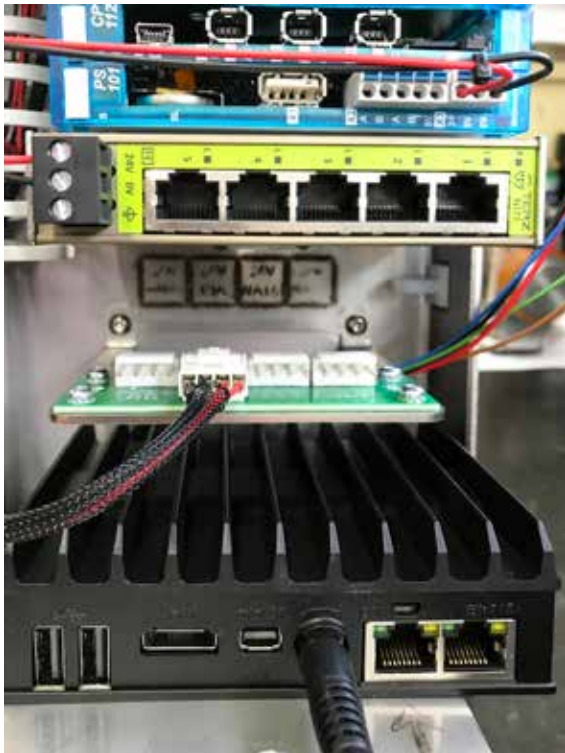
Sigmatek SlamLoc ist für den Betrieb auf 64-bit Industrie-PCs optimiert und wird von Sigmatek auch als Bundle einschließlich der Hardware mit WLAN-Anschluss (unten) angeboten.

wege anpassen lassen. Damit schaffen sie eine der Grundlagen für sich selbst optimierende Produktionsprozesse von Industrie 4.0. Die Bandbreite der angebotenen Produkte reicht von völlig autonom navigierenden Einzelfahrzeugen bis zu abgeschlossenen Systemen. Zu den Kunden von Sigmatek gehören einige FTS- und AMR-Hersteller. Sie nutzen die Produkte des österreichischen Herstellers von innovativen Automatisierungssystemen in erster Linie in der Bordsteuerung, Sicherheits- und Antriebstechnik ihrer Fahrzeuge. Sie schätzen vor allem die Kombination aus extrem geringen Abmessungen, hoher Energieeffizienz und kompromissloser Industrietauglichkeit. Die Leitsteuerung der Fahrzeuge erfolgt meist mittels proprietärer Softwaresysteme ihrer Hersteller oder durch Individualprogrammierung.