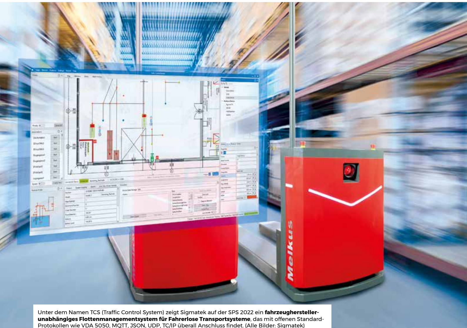
Unter dem Namen TCS (Traffic Control System) zeigt Sigmatek auf der SPS 2022 ein fahrzeughersteller-unabhängiges Flottenmanagementsystem für Fahrerlose Transportsysteme , das mit offenen Standard-Protokollen wie VDA 5050, MQTT, JSON, UDP, TC/IP überall Anschluss findet.