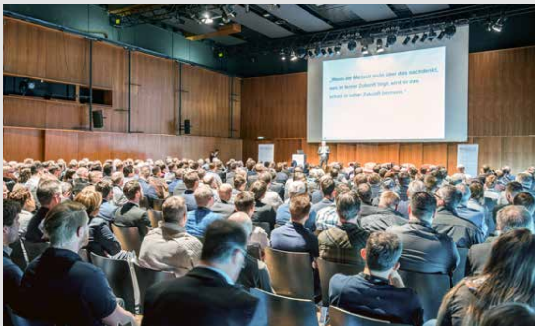
Rund 340 Besucher waren der Einladung zu den Meusburger Werkzeug- und Formenbautagen im Bregenzer Festspielhaus gefolgt.