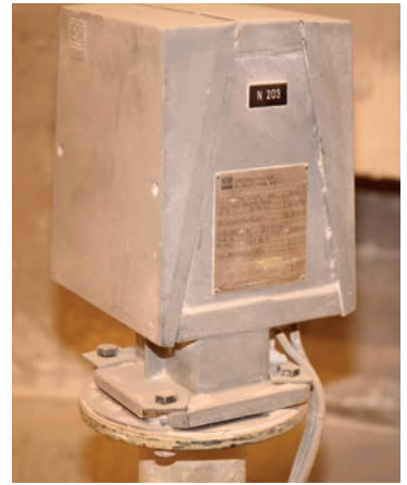
Auch ein Silopilot FMM460 bewährt sich seit Jahrzehnten im Zuckersilo.