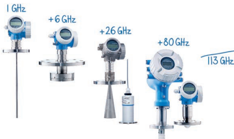
Feldmessgeräte von Endress+Hauser messen mittels vieler Technologien zahlreiche physikalische Größen. Allein die Vielfalt der Frequenzen bei Radar-Füllstandmessgeräten ist beeindruckend.