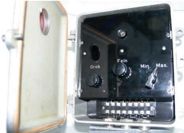
Eines der ersten von Endress+Hauser selbst entwickelten Geräte war der 1956 vorgestellte Messumformer Nivotester.