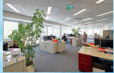
Der 1990 neu errichtete Firmensitz von Endress+Hauser Österreich in Wien-Liesing bietet reichlich Platz für Büros, Lager, Werkstätten und Schulungsräume.