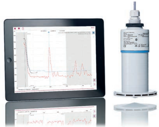
Bluetooth-Kommunikation über die SmartBlue-App auf mobilen Endgeräten vereinfacht Inbetriebnahme, Betrieb und Wartung von Geräten wie den Radar-Füllstandmessgeräten Micropilot FMR10 und FMR20.