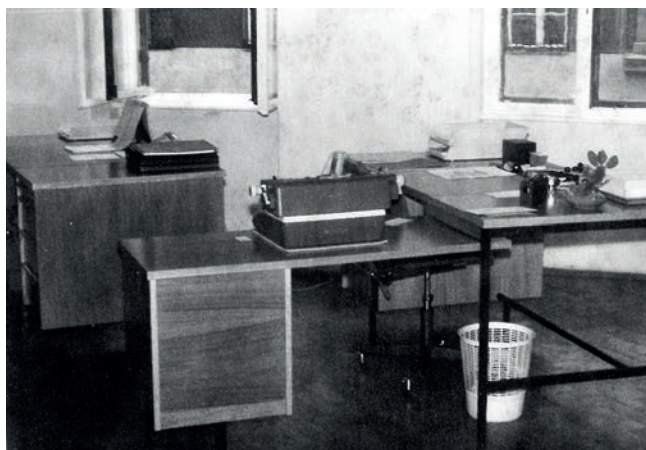
Bescheiden waren die Anfänge von Endress+Hauser Österreich mit 40m² Büro und 20 m² Lager an zwei getrennten Standorten.