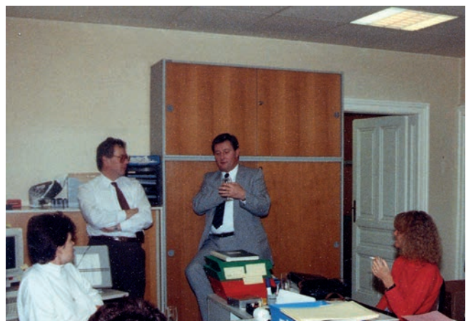
Mehrere Erweiterungen waren nötig, um mit dem raschen Firmenwachstum mitzuhalten. Bis Ende der 1980er-Jahre war Endress+Hauser Österreich in adaptierten Wohnungen untergebracht.