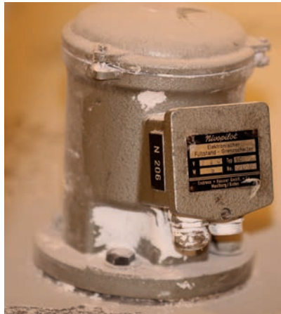
Langlebig: Bei Manner dient eine kapazitive Seilsonde seit den 1960er-Jahren zur max. Abschaltung im Zuckersilo.