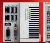
CX5120: Intel®-Atom™-CPU, 1,46 GHz, single-core

Mit der Embedded-PC-Serie CX5100 etabliert Beckhoff eine neue kostengünstige Steuerungskategorie für den universellen Einsatz in der Automatisierung. Die drei lüfterlosen, hutschienenmontierbaren CPU-Versionen bieten dem Anwender die hohe Rechen- und Grafikleistung der Intel®-Atom™-Mehrkern-Generation bei niedrigem Leistungsverbrauch. Die Grundausstattung enthält eine I/O-Schnittstelle für Busklemmen oder EtherCAT-Klemmen, zwei 1.000-MBit/s-Ethernet-Schnittstellen, eine DVI-I-Schnittstelle, vier USB-2.0-Ports sowie eine Multioptionsschnittstelle, die mit verschiedensten Feldbussen bestückbar ist.