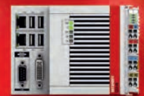
CX5140: Intel®-Atom™-CPU, 1,91 GHz, quad-core