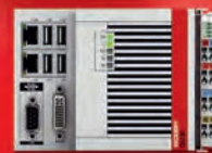
CX5130: Intel®-Atom™-CPU, 1,75 GHz, dual-core