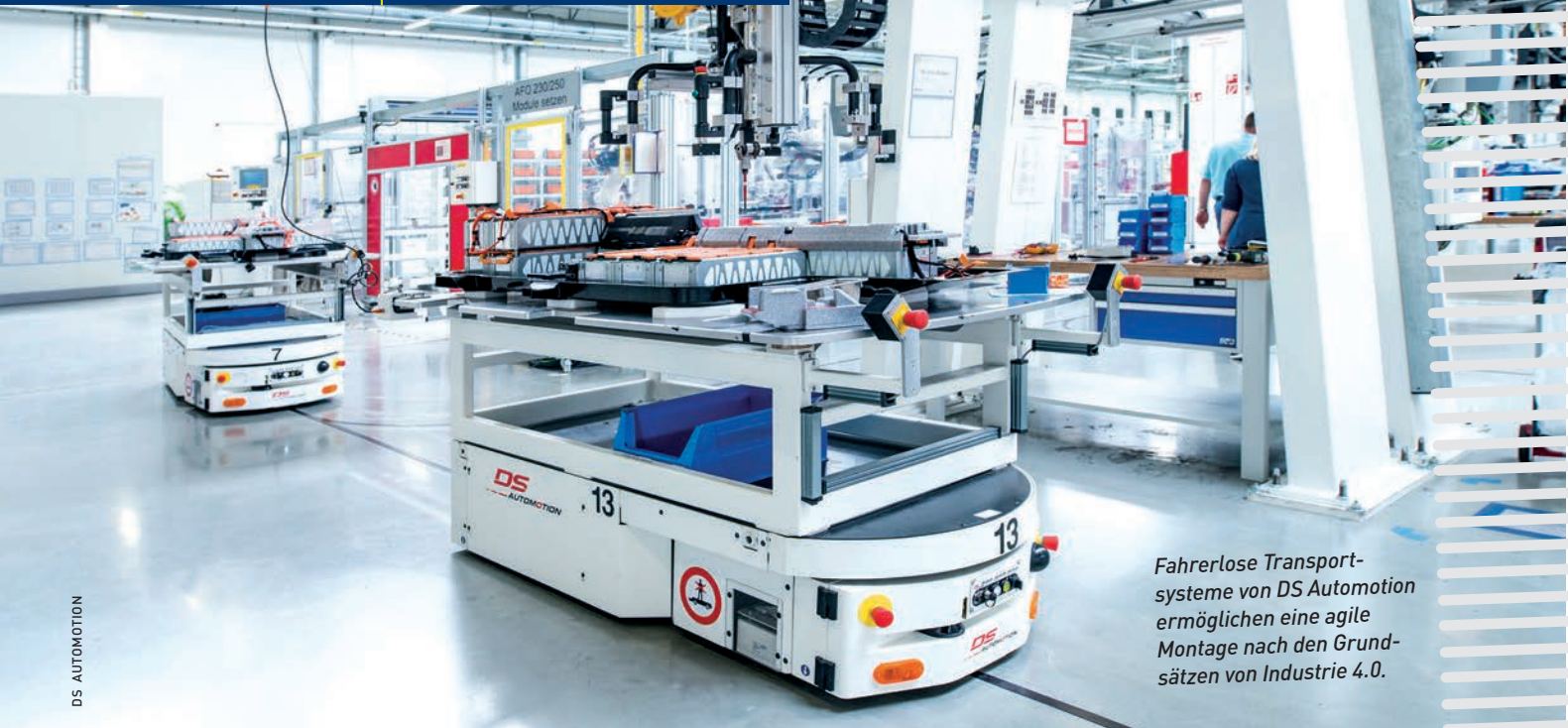
Fahrerlose Transportsysteme von DS Automation ermöglichen eine agile Montage nach den Grundsätzen von Industrie 4.0.