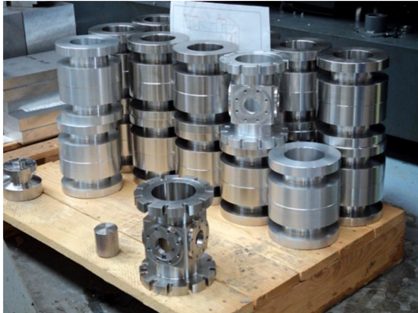
Komplexe und präzise Teile für die Vakuumtechnik fertigt die Wolf Fertigungs- und Fügetechnik GmbH in Mieming aus verschiedenen Edelstählen und Buntmetallen.

Wertschöpfung und zu einer Erweiterung des Tätigkeitsspektrums in Richtung der spanabhebenden Bearbeitung führte.