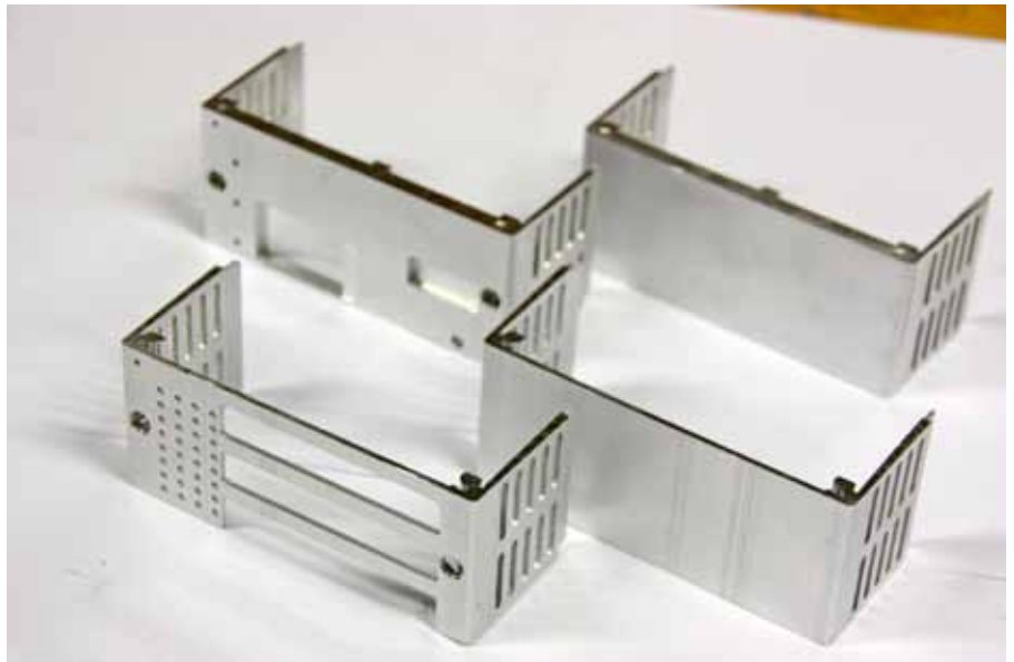
An den sehr dünnwandigen Teilen müssen zahlreiche Operationen durchgeführt werden. Da spielt in der mechanischen Bearbeitung ein schneller Werkzeugwechsel und dynamische Verfahrswege, sowie beim Handling eine ausgeklügelte Greifertechnologie eine entscheidende Rolle.

Viel Intelligenz steckt in den Vierfach-Aufspannvorrichtungen in den Maschinen selbst. Diese sind so gestaltet, dass sie für alle möglichen Varianten der Modulgehäuse und für deren Bearbeitung von vorne und hinten ohne Umspannen geeignet sind. Da dieselbe Aufspannvorrichtung für alle Produkte stets in der Maschine bleiben kann, erfolgt die Umstellung von einem Modultyp zum Nächsten ausschließlich per Programmwechsel. So kann innerhalb weniger Sekunden gewechselt und die Produktion der Elektronikmodule bereits von den Gehäuseteilen an nachfragegerecht, im Extremfall sogar auftragsbezogen erfolgen. Ebenfalls Teil der Anlage ist eine Messvorrichtung, in die der Roboter