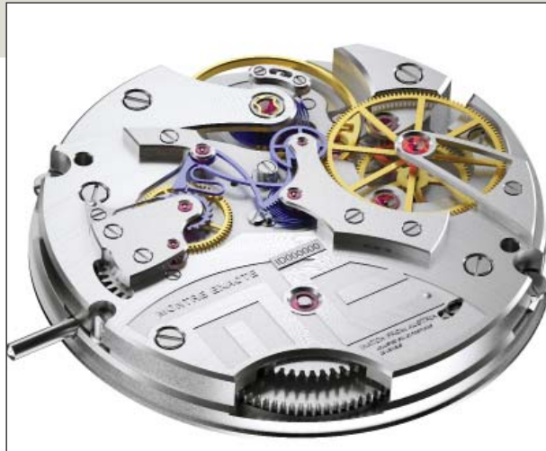
Die Bewegung des Viertelzeigers steuert der einzigartige Vierteljumper in Form eines Sektglases (in blau), der durch den transparenten Boden des Uhrgehäuses zu sehen ist.

„Solid Edge ist sehr schnell und hat eine besonders einfache Menüführung, mit der sich neue Dateien erstellen und Anpassungen sowohl in der Einzelteilumgebung als auch aus der Baugruppe durchführen lassen.“