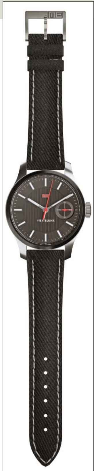
Präsentationsbilder direkt aus den Solid Edge Daten zeigen bessere Detailtreue als Fotos der fertigen Uhr und unterstützen einen frühzeitigen Verkaufserfolg.